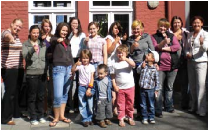
TEP-Teilnehmer: Ihr tägliches Leben mit Kind(ern) sollte sie zu gefragten Arbeitskräften machen.

fahren: TEP – ein neues Projekt des Sozialwerks Aachener Christen – steht für „Teilzeitberufsausbildung - Einstieg begleiten - Perspektiven öffnen“ und bietet Müttern und Vätern die Chance einer Ausbildung in Teilzeit. Das Pilot-Projekt des NRW-Ministeriums für Arbeit, Gesundheit und Soziales, finanziert durch den Europäischen Sozialfonds, baut dabei besonders auf die stark ausgebildeten sozialen Kompetenzen der Eltern.