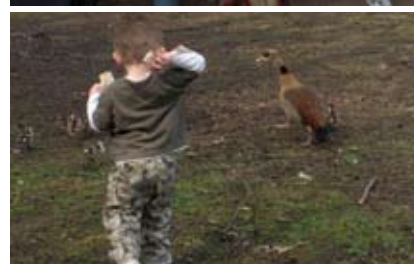
Gemeinsam macht alles mehr Spaß