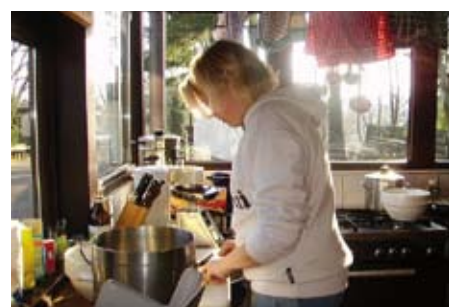
Das Hütten-Hotel managen die Schüler

Unterstützen Sie die Arbeit des Sozialwerks Aachener Christen und spenden Sie unter dem Stichwort: Rosfabrik